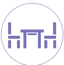
イス・テーブル など

※人体に向けて使用しないでください。※すべての材質に使用できるわけではありません。(水分やアルコールに弱い材質などは不可) ※便座以外でご使用の際は、必ず目立ちにくい箇所で試してからご使用ください。