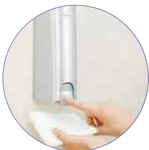
ワンプッシュで手軽に除菌