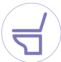
洋式トイレ (便座・フタなど)