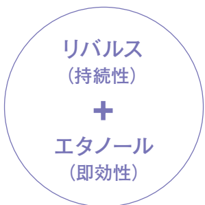
除菌剤はダブル効果を発揮