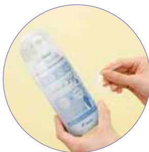
密封スプレータイプなので異物混入なく衛生的