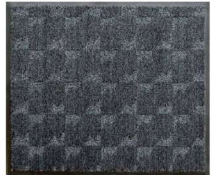
シルバー/ブラック