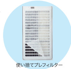
使い捨てプレフィルター